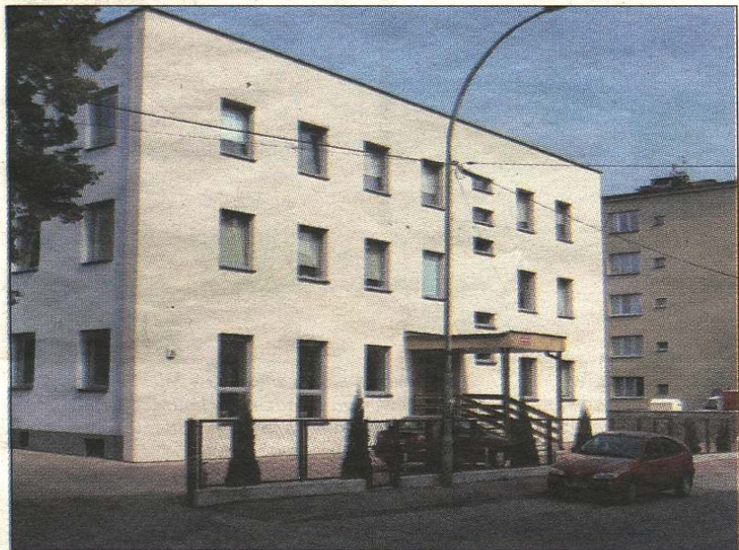
Siedziba MPEC-u w Mielcu przy ul. Grunwaldzkiej.

We wrześniu 1988 roku na bazie Oddziału Gospodarki Ciepłej Miejskiego Zarządu Budynków Mieszkalnych powstało przedsiębiorstwo państwowe o nazwie, która funkcjonuje do dziś czyli Miejskie Przedsiębiorstwo Energetyki Ciepłej w skrócie zwane MPEC. W roku 1991 przedsiębiorstwo zostało skomunalizowane i przekształcone w zakład budżetowy, a od 1 stycznia 1998