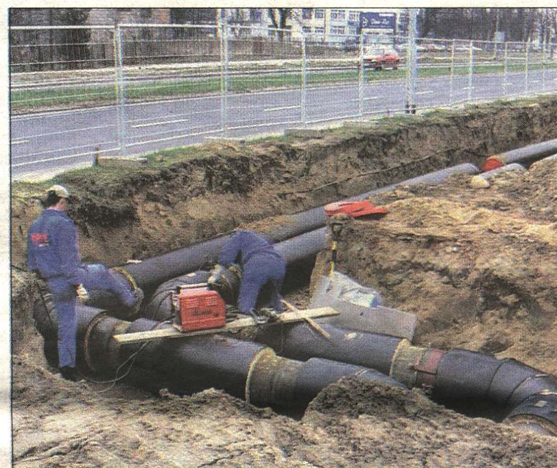
Montaż sieci magistralnej przy ul. Kwiatkowskiego.

przedstawiciele mieleckich osiedli. MPEC-owskie hasło "Z nami ciepłej" podkreśla, iż spółka chce otaczać swoich klientów ciepłem, które jest niezawodne, bezpieczne, ekologiczne i ekonomiczne. Jednocześnie MPEC staje się firmą otwartą na kontakty ze swoimi obecnymi i potencjalnymi odbiorcami. W tym celu również udostępnia najistotniejsze informacje o swojej działalności na stronie internetowej www.mpec.mielec.pl